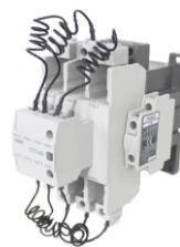
Para CT50 a CT85 For CT50 to CT85 CTC-50