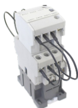
Para CT9 a CT40 For CT9 to CT40 CTC-9